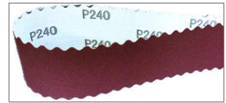
※ウェーブエッジ仕様